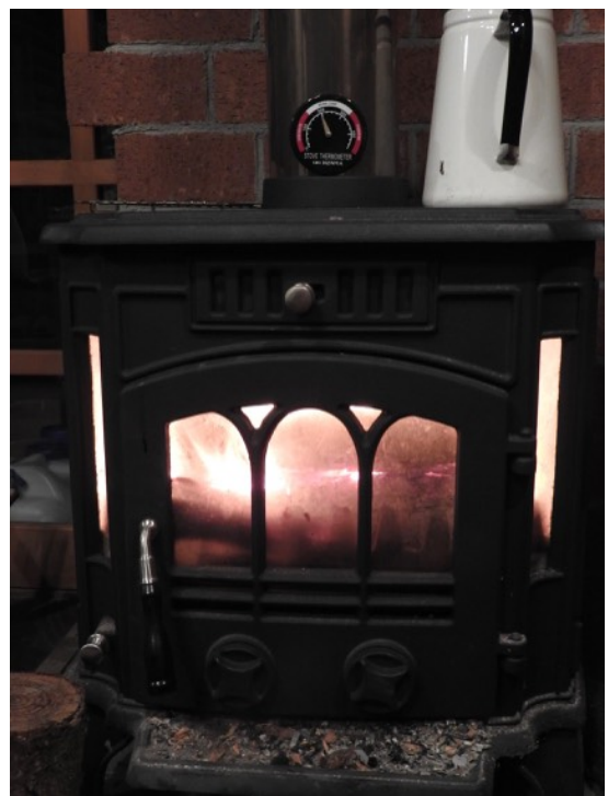
丁度良い太さの唐松 薪ストーブは200℃