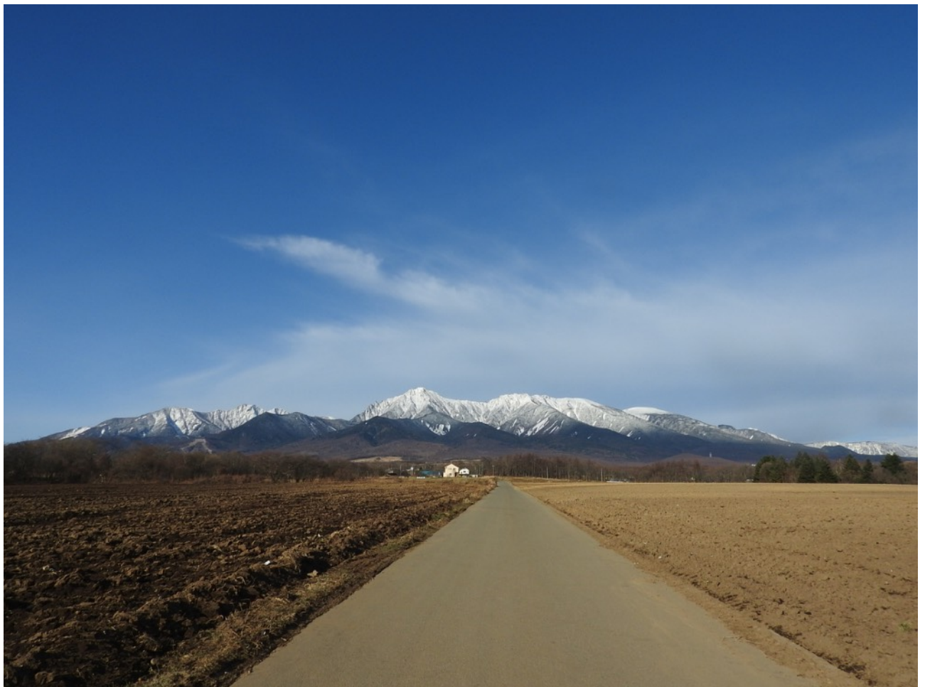
野辺山（保育園）キャベツ畑の真っ直ぐのびた農道から八ヶ岳を望む。