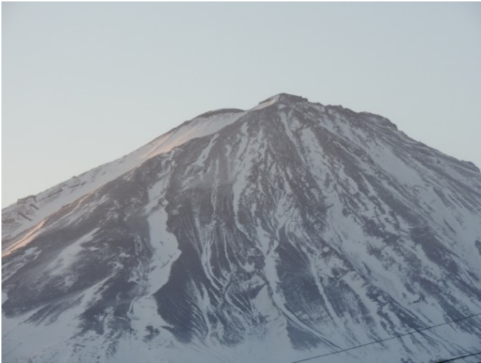
夜明け前、河口湖付近からの富士山